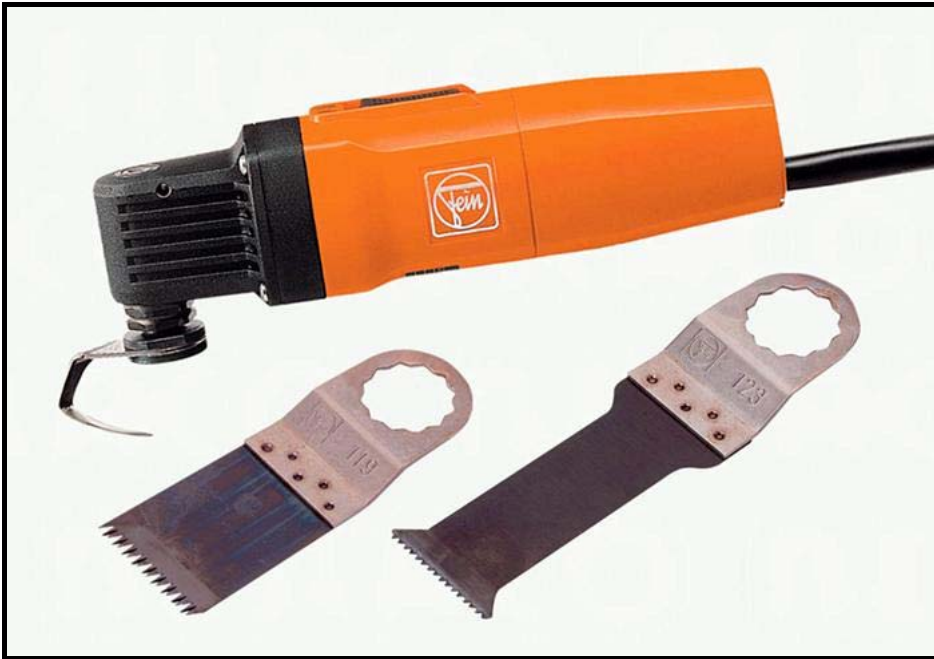
Foto: FEIN-skærer monteret med fugekniv velegnet til dybe fuger.

Er der tale om en facadefuge med et lavere indhold af PCB, og det konstateres, at PCB-en ikke har spredt sig til den omkringliggende mur, vil det normalt være nok at anvende let håndværktøj som for eksempel en el-kniv eller en rillefræser til at fjerne fugen.